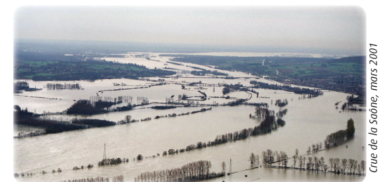
Crue de la Saône, mars 2001