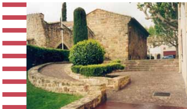
Exemple d'une intégration architecturale réussie d'une rampe d'accès dans un environnement préservé.

commun, volonté de créer des zones de rencontre ou de réduire la circulation automobile, demandes d'association, etc.).