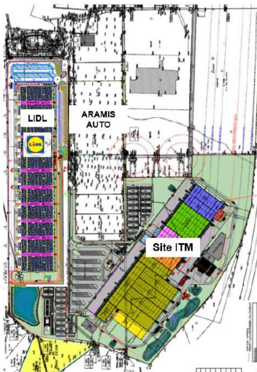
Figure 2: Localisation du projet dans la partie sud de la zone d'activité des éoliennes et localisation du projet ITM voisin

Des terrains situés immédiatement à l'est du projet ont fait l'objet d'une mise en compatibilité du plan local d'urbanisme (PLU) pour l'extension de la zone d'activité des éoliennes vers le sud sur environ 14 hectares. L'Autorité environnementale s'est prononcée quant à cette mise en compatibilité le 21 mai 2019 6 , ainsi que le 14 octobre 2019 au sujet du projet de plateforme logistique présenté par la société ITM Logistique Alimentaire Internationale 7 sur près de 28 hectares en partie sud de la zone des éoliennes et immédiatement à l'est des terrains objet du projet étudié dans le présent avis. La plateforme logistique de la société ITM, classée Seveso seuil bas 8 , est actuellement en cours de construction. L'étude d'impact est fournie dans le cadre d'une demande d'autori-