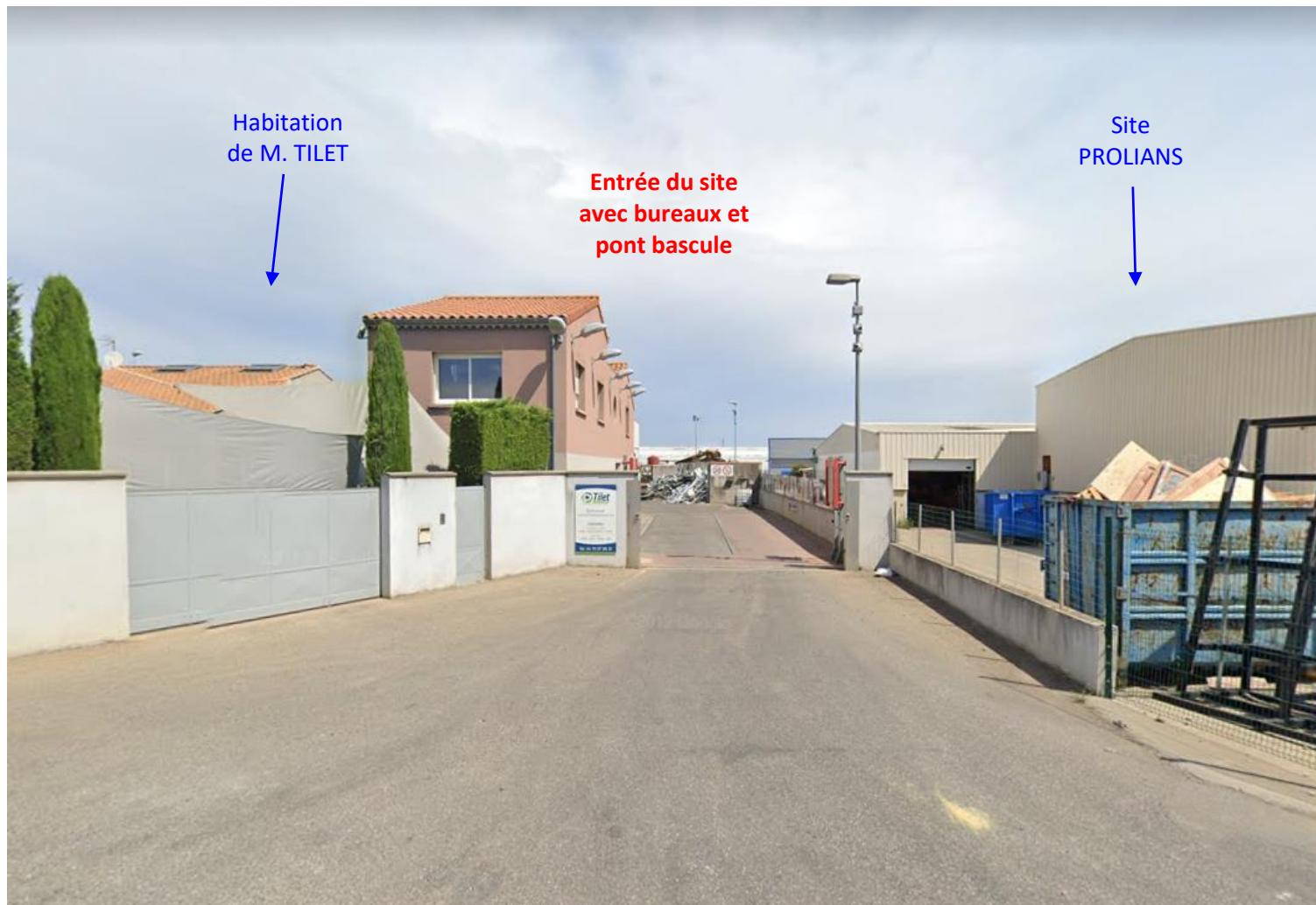
Vue n°1 : Vue de l'entrée du site principal, depuis l'impasse du quartier de Peyrollet