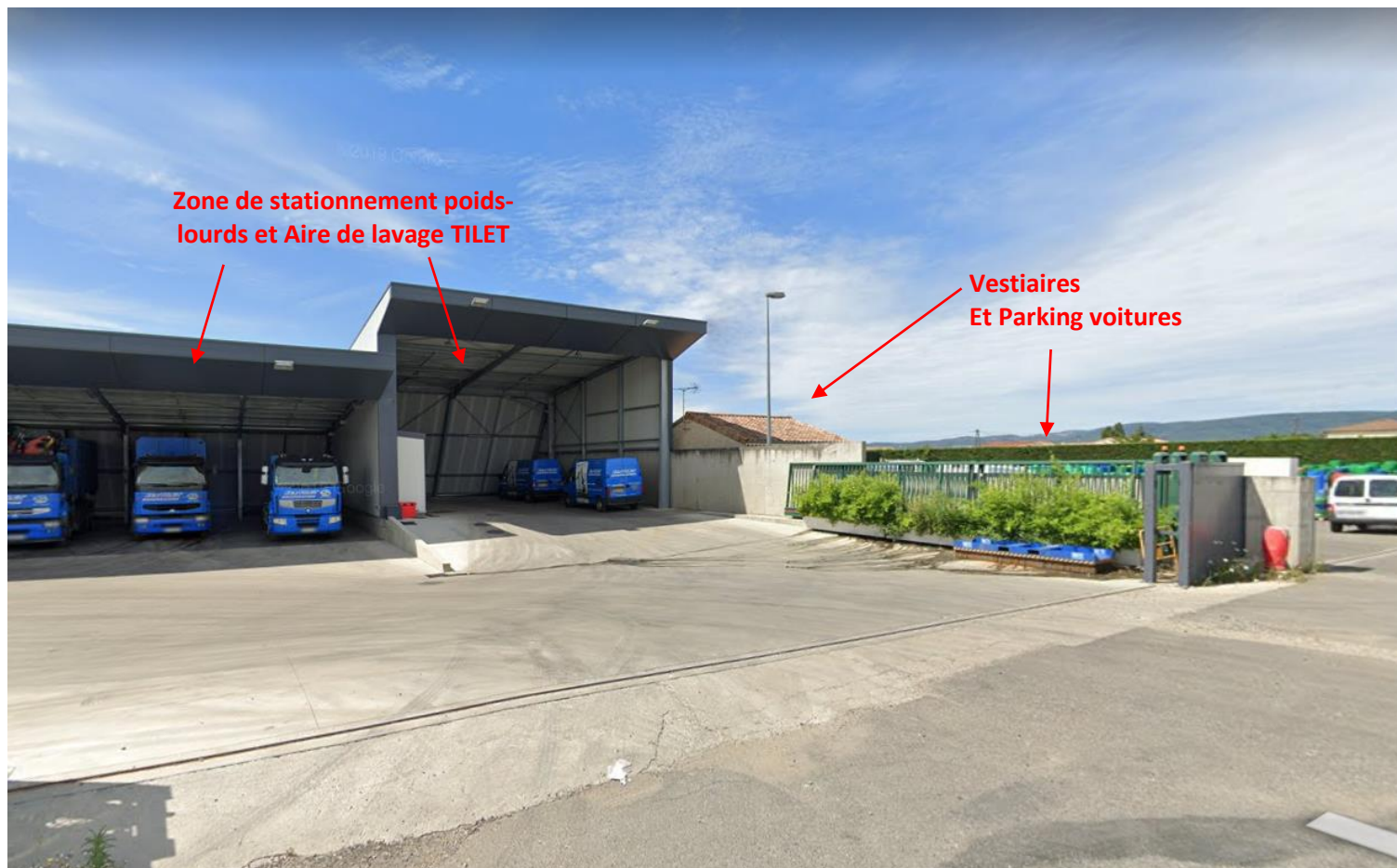
Vue n°2 : Vue des zones sud du site, depuis l'impasse du quartier de Peyrollet