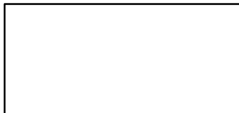
Signature du chauffeur au milieu du cadre noir