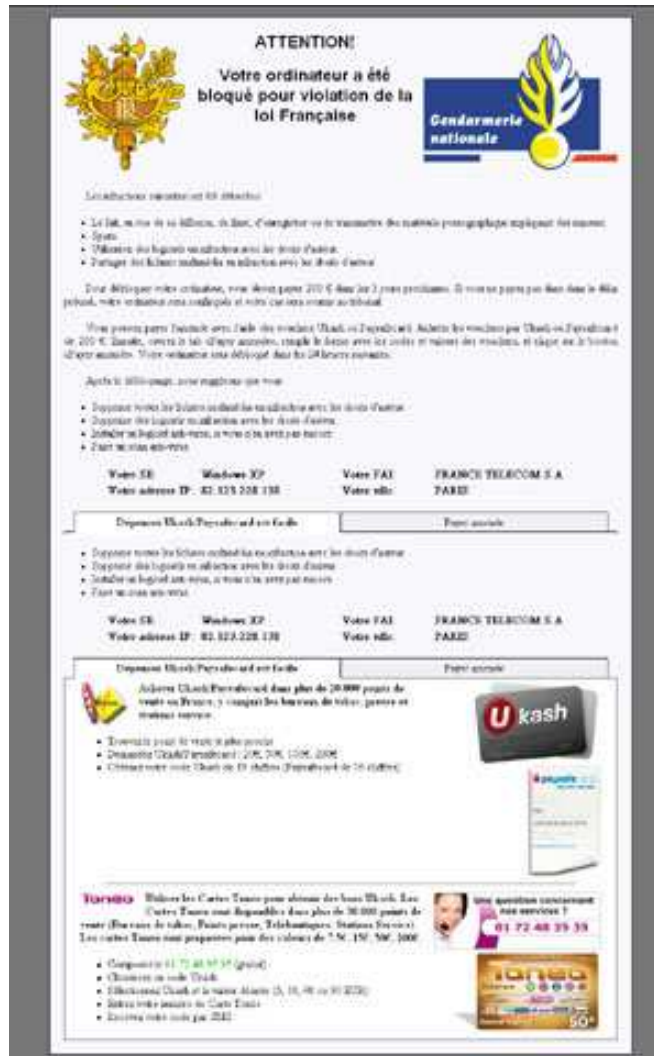
Figure 1 : copie d'écran d'un ordinateur bloqué par la variante « Goldenbaaks » des rançongiciels (03/2012).

VIRUS POLICE GENDARMERIE et autres rançongiciels : La procédure de désinfection est disponible sur : www.malekal.com.