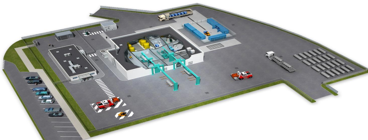
Figure 2 : Vue aérienne de l'atelier AMC2 : au centre, le bâtiment de lavage ; en haut à droite, la plateforme d'expédition des cylindres sur le site Orano de Malvésí.