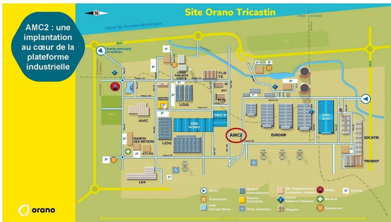
Figure 1 : Localisation du projet AMC2 sur la plateforme Orano du Tricastin.

Pour poursuivre certaines des activités actuellement mises en œuvre dans l'atelier AMC, Orano prévoit de créer un nouvel atelier sur un autre emplacement du même site et de l'inclure dans le périmètre d'une autre INB, réglementée et contrôlée par l'Autorité de sûreté nucléaire (ASN).